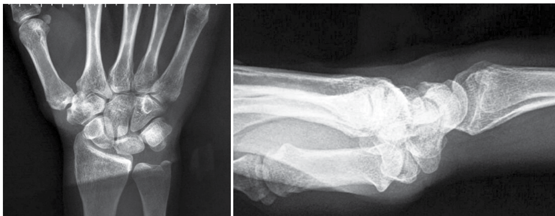
▲ Figura 1. Par radiológico. Sin lesión ósea evidente.

En las imágenes de la RM, se destacan dos hallazgos principales. Por un lado, se advierte edema óseo en el extremo distal del radio (Figura 2). El edema óseo es un hallazgo inespecífico en la semiología de la RM en la patología ósea. Sin embargo, el antecedente de la paciente obliga a pensar, en primer término, su origen traumático que indica una fractura trabecular. El otro hallazgo cardinal del caso consiste en la alteración de señal que involucra selectivamente a un músculo del compartimiento posterior del antebrazo con afectación preferencial de la unión miotendinosa (Figura 3).