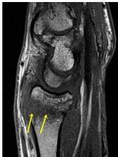
Figura 4. Corte sagital T1. Se distingue el trazo fracturario principal que une las corticales anterior y posterior. Hay otra línea fracturaria en el sector anterior de la epífisis visible como una imagen lineal hipointensa que alcanza la cortical anterior, sin desplazamiento.

En nuestro caso, se puede ver claramente el trazo fracturario sin desplazamiento en el plano sagital, tipo Colles (Figura 4), la retracción tendinosa del cabo proximal del ELP (Figura 5) y el trayecto filiforme a la altura del tubérculo de Lister (Figura 6).