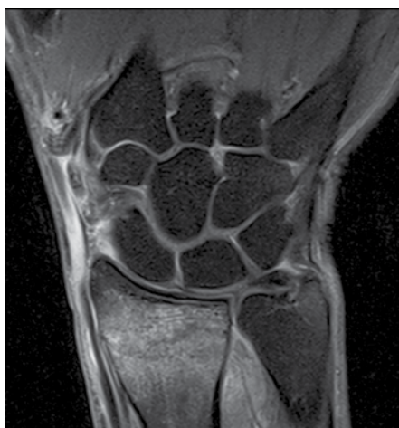
▶ Figura 2. Corte coronal DP FatSat. Se observa un aumento difuso de la señal en la médula ósea del radio distal, indicativo de edema.