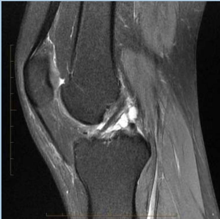
Fig. 3: Secuencia T2 Sagital con saturación de grasas. Ganglion intraarticular en la vaina del ligamento cruzado anterior.