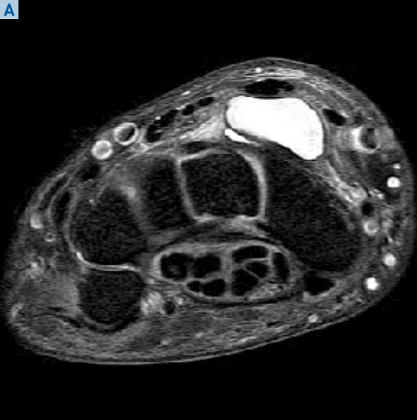
Fig. 1A: Secuencia axial T2 con saturación de grasas. Ganglion ovoide con localización típica en el dorso de la articulación radioescafoidea.

tamiento quístico, hipo o isointensas al músculo en secuencias potenciadas en T1, que característicamente presentan alta señal interna en las secuencias sensibles al líquido; a veces esto puede verse alterado, ya sea por mayor tiempo de evolución o bien por presencia