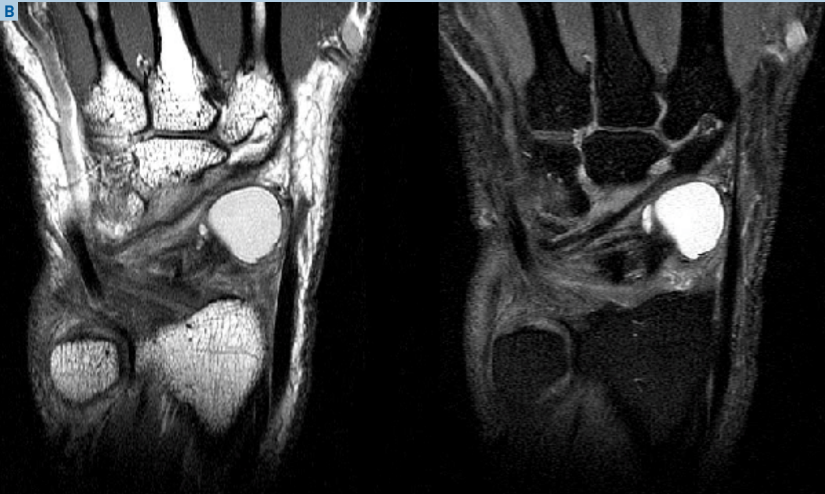
Fig. 1B: Secuencias coronal T1 y T2 con saturación de grasas. Se muestra la relación del ganglion con los ligamentos del dorso del carpo y un microquiste satélite.